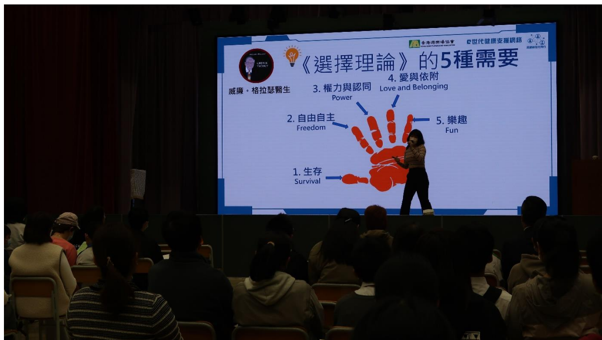
講座題目：「提升學生資訊素養」