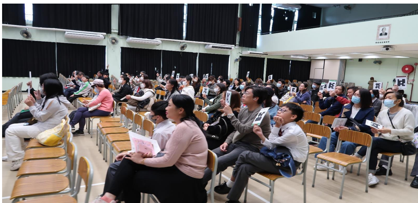
講座有約 44 位家長參加