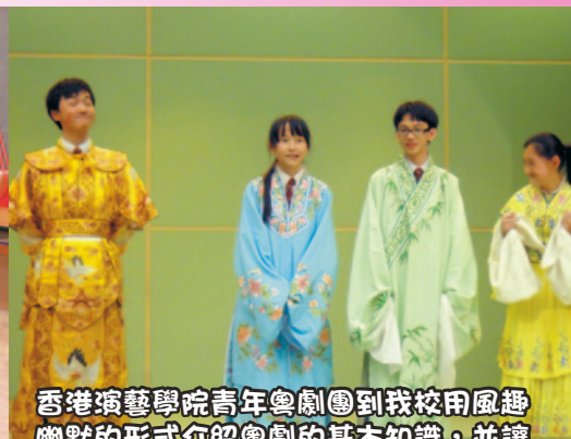
香港演藝學院青年粵劇團到我校用風趣幽默的形式介紹粵劇的基本知識，並讓同學嘗試齊戲唱