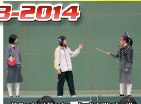
F1 Readers' Theatre – English Week will cast a spell on you.