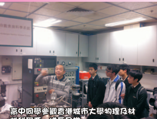
高中同學參觀香港城市大學物理及材料科學系，增長見識