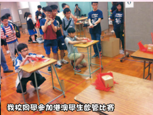
我校同學參加港澳學生飲管比賽