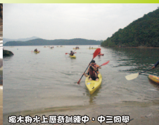
獨木舟水上歷奇訓練中，中三同學發揮團隊合作精神，順利完成任務