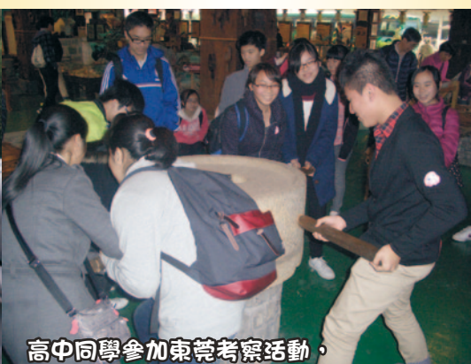
高中同學參加東莞考察活動，走出課堂，增廣見聞