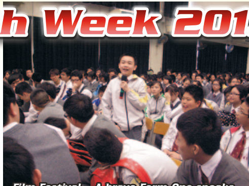
Film Festival – A brave Form One speaks English with the whole school watching.