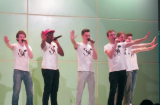
來自英國無伴奏合唱隊 ---The sons of pitches 到我校作精彩演出