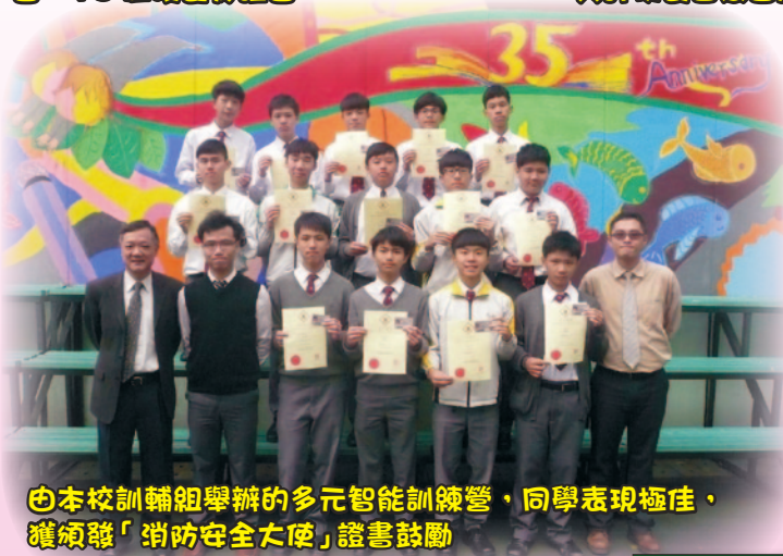
由本校訓輔組舉辦的多元智能訓練營,同學表現極佳,獲頒發「消防安全大使」證書鼓勵