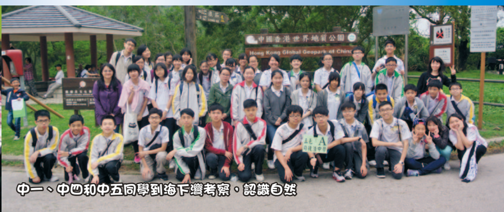
中一、中四和中五同學到海下灣考察，認識自然