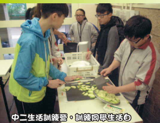
中二生活訓練營，訓練同學生活自理能力