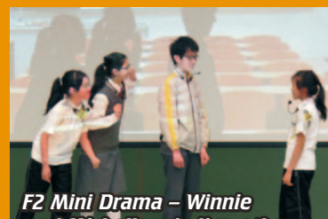
F2 Mini Drama – Winnie and Michelle minding other people's business.

I feel very happy to share how I felt in the English Week here. I was a student helper during the English Week and it boosted my confidence in speaking English. It was really challenging to me as I was the MC for F.1 Readers' Theatre and F.2 Mini Drama. I am also a member of the English Drama Club and I took part in one of the videos shown in the film festival. We could get some stamps by participating in the activities and redeem prizes during this week. It definitely motivated us. I think the English Week could help improving our English in an interesting and fun way so I enjoyed it very much. I hope I can perform even much better next year!