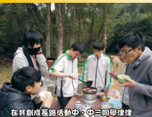
在共創成長路活動中，中三同學津津有味地吃自己親手做的飯菜