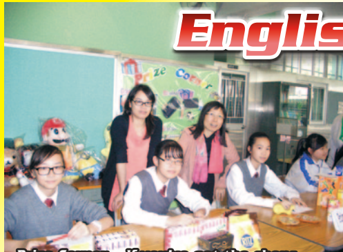
Prize Corner – If you've got the chops, we've got the props!