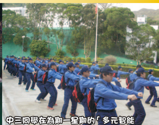
中三同學在為期一星期的「多元智能躍進計劃」中，表現令人讚賞