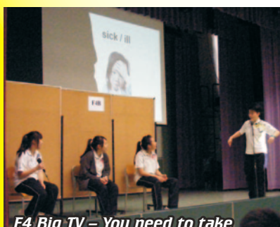
F4 Big TV – You need to take some medicine if you are ...

The English Week is an activity for students to learn more and speak more in English. Amid the English Week, all of us were asked to join the Film Festival which was held in our school hall. The videos filmed by the members of our English Drama Club were shown. We did enjoy it a lot. Dedicating songs to our friends and teachers, we were able to listen to different kinds of songs during lunch time. To me, being an English ambassador and a disc jockey, I really enjoyed it because I could chat with students who were in different forms. I think the English Week could motivate us to learn English as well as shorten the distance between students and teachers.