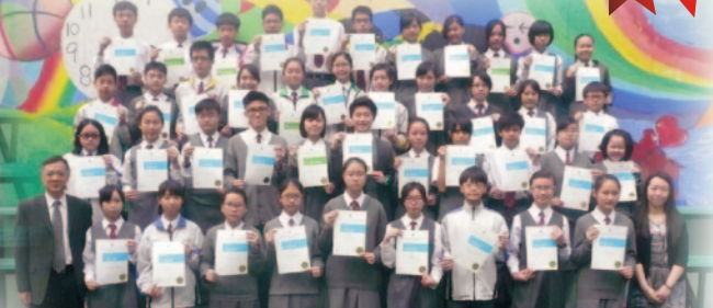
本校同學於第 65 屆「香港學校朗誦節(英文)」中,共 37 位同學獲優異證書,5 位獲良好證書