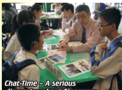
Chat-Time – A serious discussion about Singapore