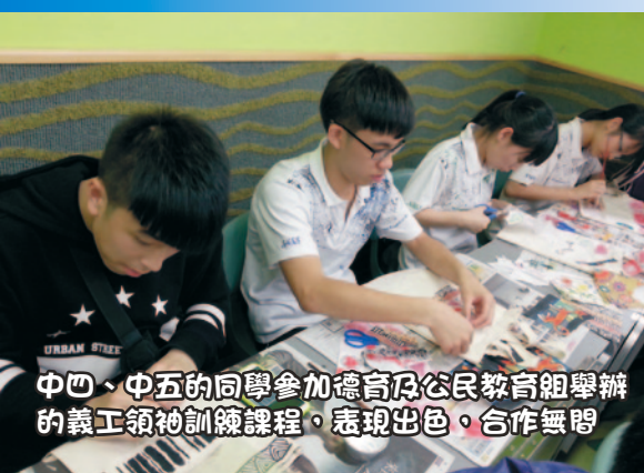
中四、中五的同學參加德育及公民教育組舉辦的義工領袖訓練課程，表現出色，合作無間