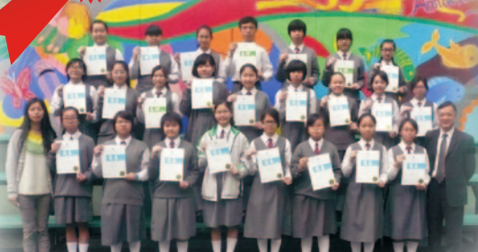
本校同學於第 65 屆「香港學校朗誦節(中文)」中,共 30 位同學獲優異證書,10 位獲良好證書