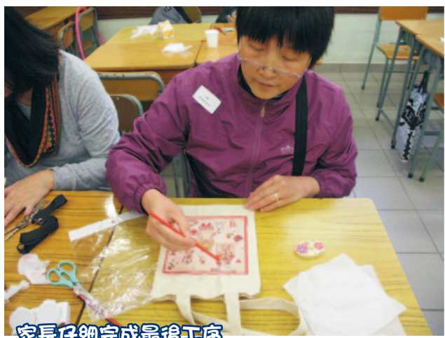
家長仔細完成最後工序