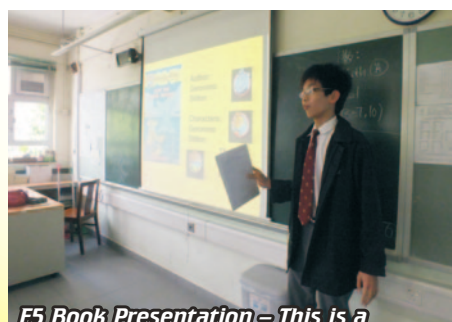
F5 Book Presentation – This is a book that I highly recommend!