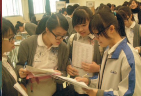
中六模範放榜，讓同學對升學掌握更多資訊